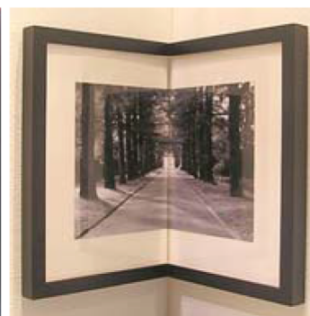
Нет такого места в интерьере, где нельзя было бы разместить раму