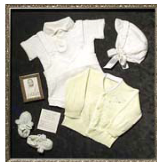
Оформление объектов (3D) позволяет сохранить их на долгую память и оригинально украсить интерьер