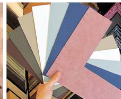
Всегда оформляйте постеры, акварели, офорты и другие изображения на бумаге с широкими полями паспарту