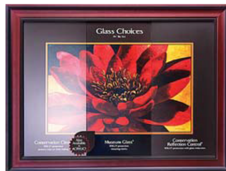
Восприятие изображения зависит от типа стекла. Обратите внимание на четкость изображения музейного стекла (по центру)